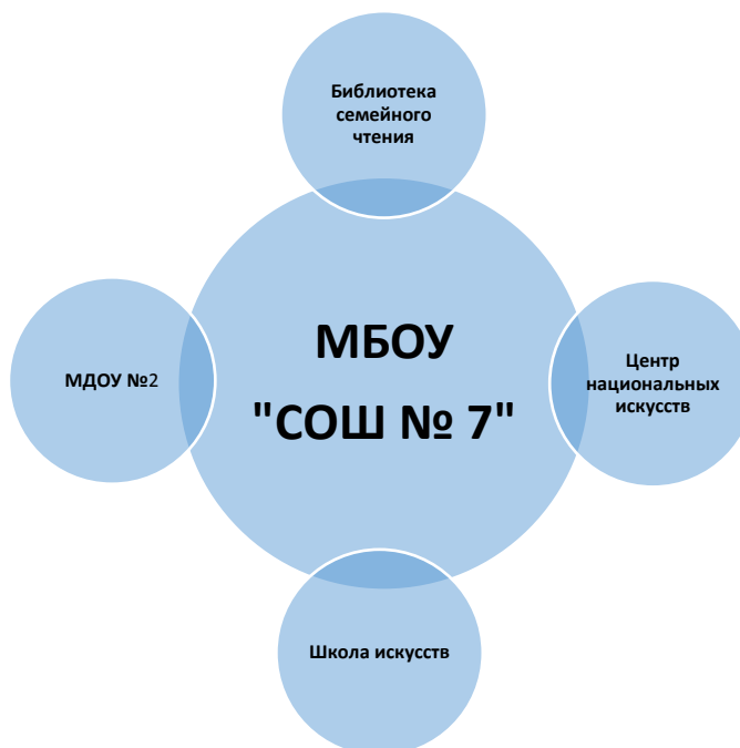
Схема социального партнерства