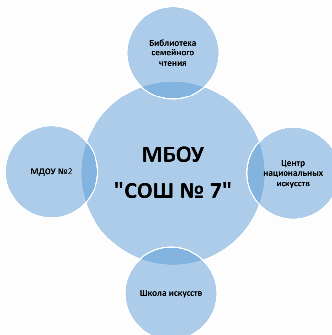
Схема социального партнерства