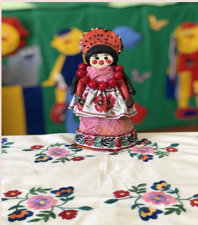
Фото- выставка : Куклы разных народов.