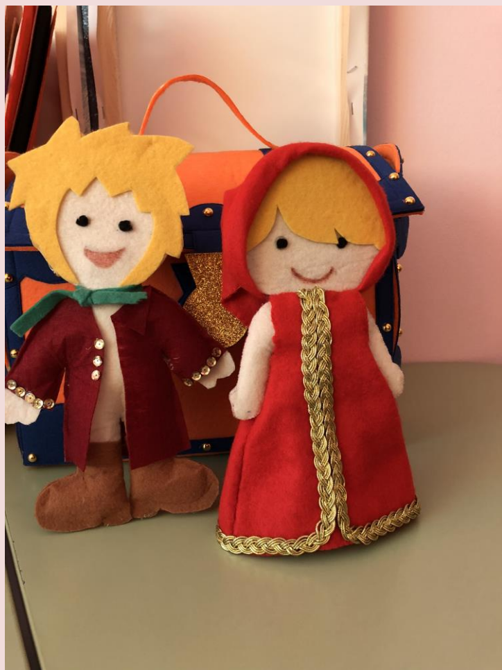
Фото- выставка : Куклы разных народов.