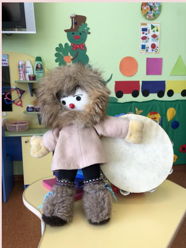
Фото- выставка : Куклы разных народов.