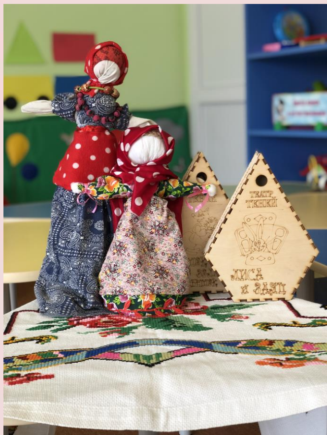
Фото- выставка : Куклы разных народов.